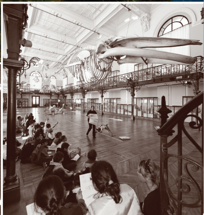
CMB, partenaire du Musée Océanographique de Monaco : action pédagogique auprès des élèves des écoles.