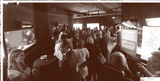
CMB, partenaire du Musée Océanographique de Monaco : Conférence de Pierre-Yves COUSTEAU, 27 septembre 2011